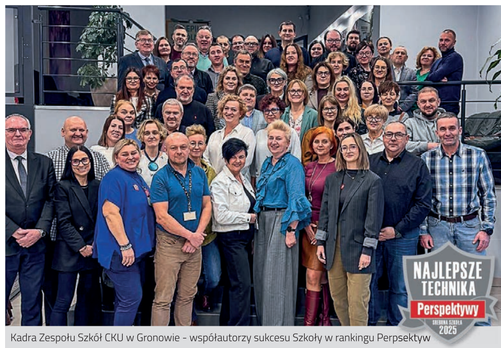
Kadra Zespołu Szkół CKU w Gronowie – współautorzy sukcesu Szkoły w rankingu Perspektyw

VI TOM SŁOWNIKA BIOGRAFICZNEGO POWIATU TORUŃSKIEGO