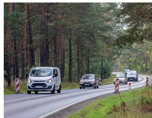
Przebudowana DW 258 Osiek - Dzikowo

a jesienią rozpoczęto kolejny etap za 3 mln zł. Przy sprzyjających warunkach cała trasa (ok. 8 km) będzie przejezdna pod koniec roku,