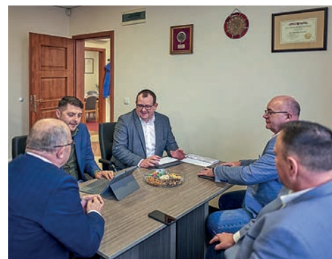
Przebudowana DW 258 Osiek - Dzikowo

Przygotowanie dokumentacji do budowy ronda w Chełmży na skrzyżowaniu ulic Chełmińskie Przedmieście i 3 Maja – zadanie