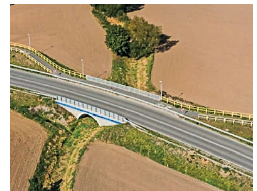
Kładka pieszko-rowerowa w Złejwsi Małej