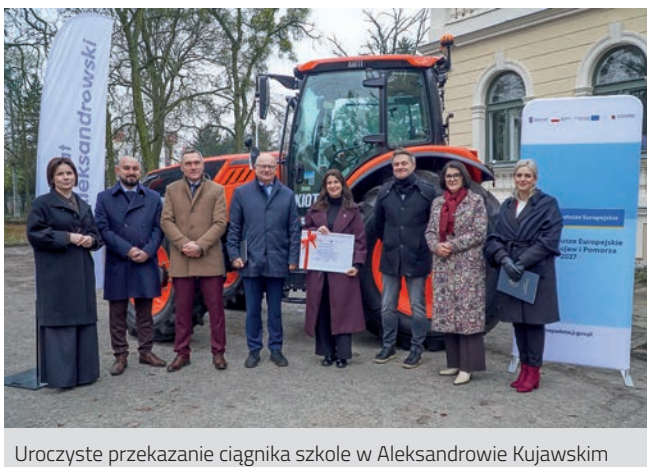
Uroczyste przekazanie ciągnika szkole w Aleksandrowie Kujawskim