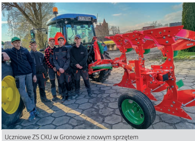
Uczniowie ZS CKU w Gronowie z nowym sprzętem