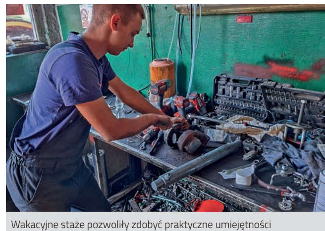
Wakacyjne staże pozwoliły zdobyć praktyczne umiejętności