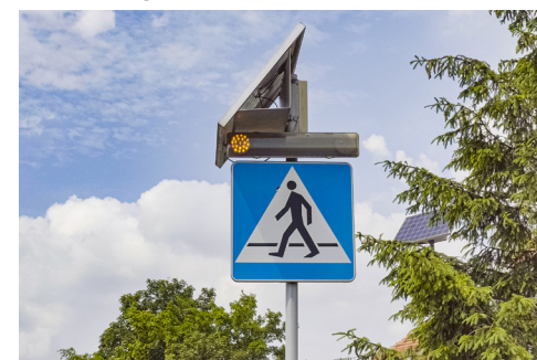
Na remontowanych trasach drogowcy instalują bariery energochłonne, balustrady, aktywne przejścia z sygnalizacją oraz wymieniają oznakowanie pionowe i niosą poziome.