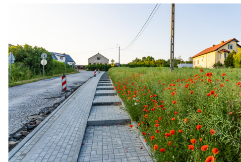
Zakończenie remontu drogi w Skłudzewie planowane jest na koniec września 2020 r.

Dzięki Funduszowi Dróg Samorządowych i zaangażowaniu środków własnych powiatu toruńskiego będzie u nas jeszcze bezpieczniej!