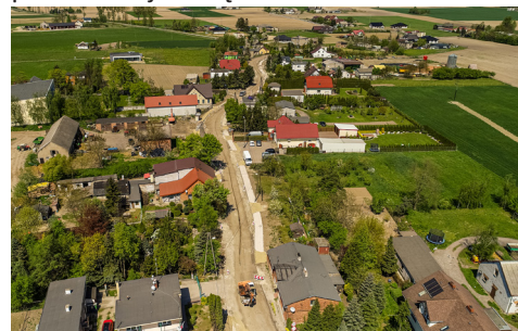
Trasa w Brąchnowie czeka na nowy asfalt.

Turzno – Rogówko – Lubicz Dolny, modernizacja ciągu dróg powiatowych Chełmińska – Bolumin – Skłudzewo oraz Gierkowo – Skłudzewo – Rzęczkowo, łączącego powiaty toruński i bydgoski, a także remont drogi powiatowej w Brąchnowie.